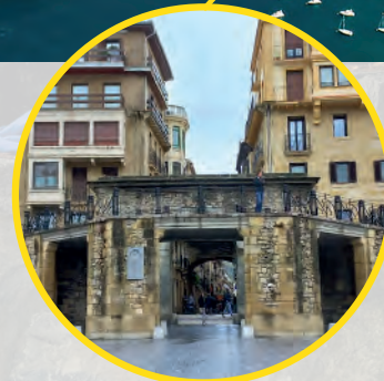
Punto de encuentro